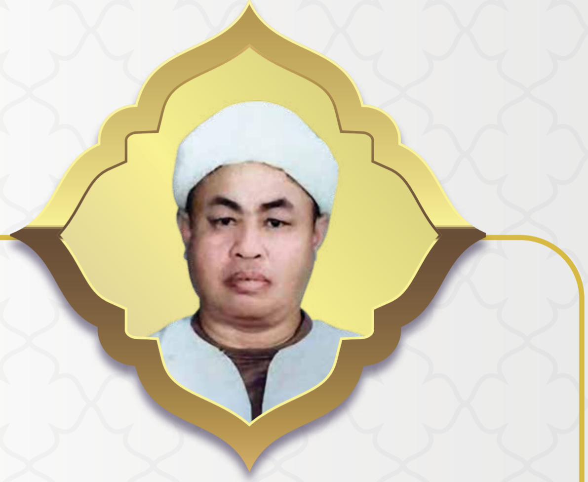
MUFTI PERTAMA KERAJAAN NEGERI, NEGERI SEMBILAN